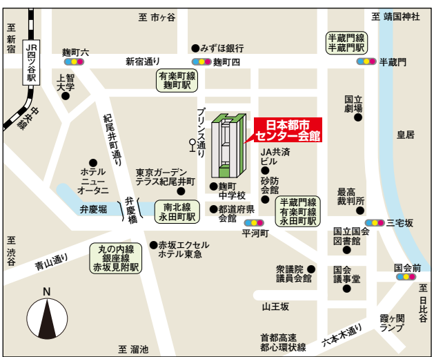
表紙：絆 From Disaster to Community Development (UNCRD)