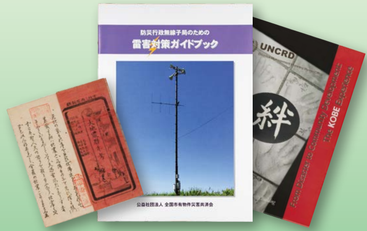
当館所蔵「大地震暦年考」安政3(1856)年、他