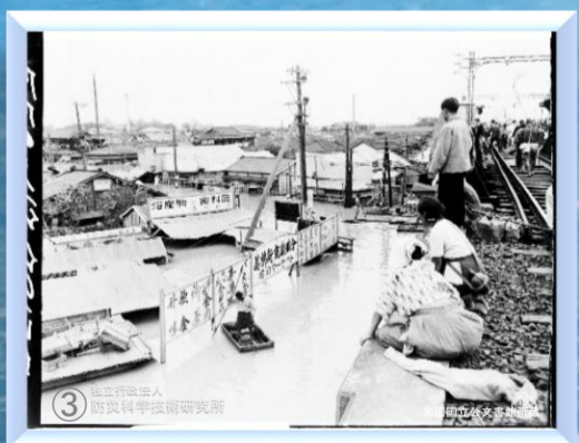
堀切菖蒲園駅付近