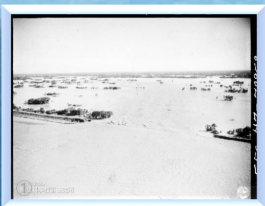
利根川右岸決壊口