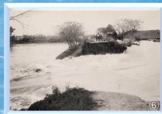
桜堤決壊口(葛飾区水元公園)