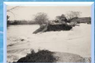
桜堤決壊口(葛飾区水元公園)