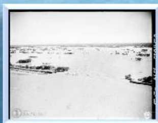
利根川右岸決壊口