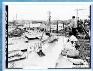
堀切葛蒲園駅付近